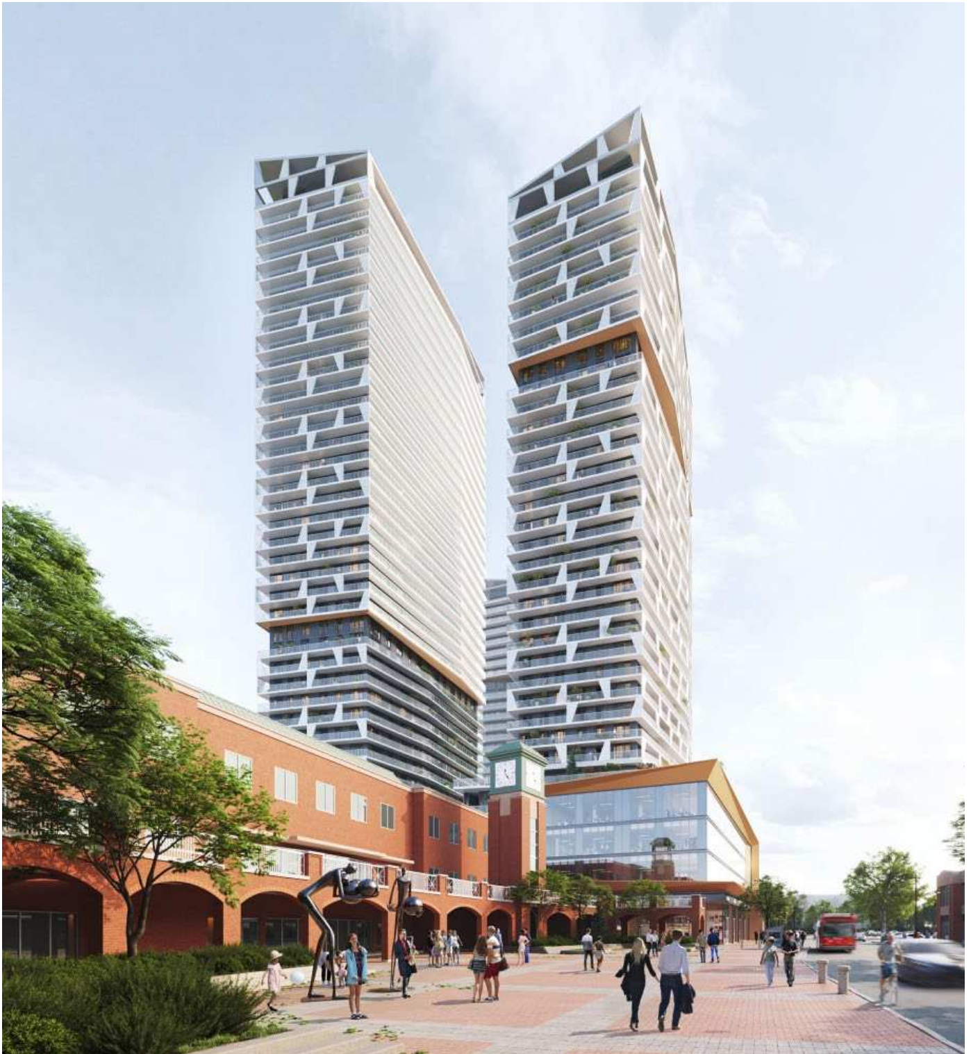
Artist rendering – view toward the east along Centrum Boulevard