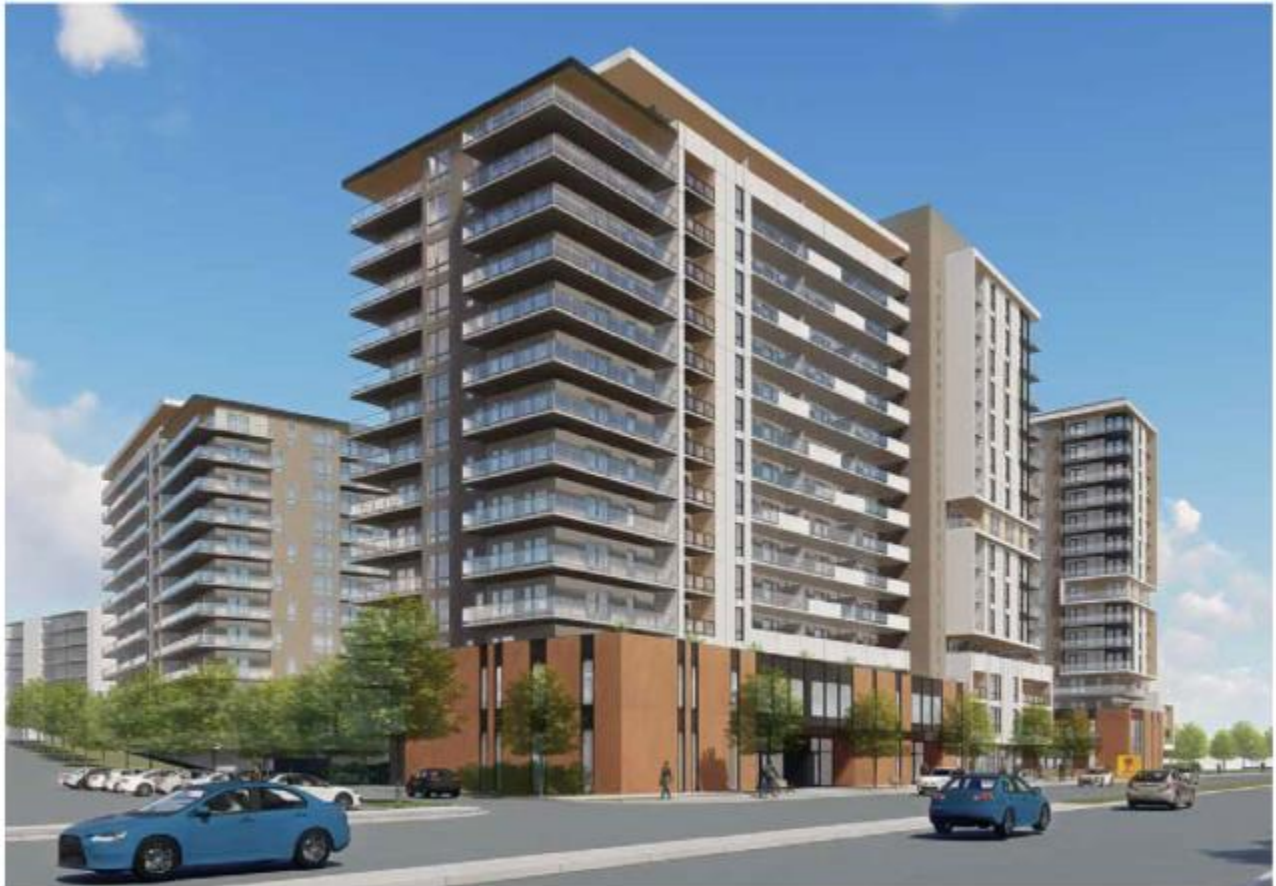
Figure 19. Tower 3 viewed looking northwest from St-Laurent Boulevard.