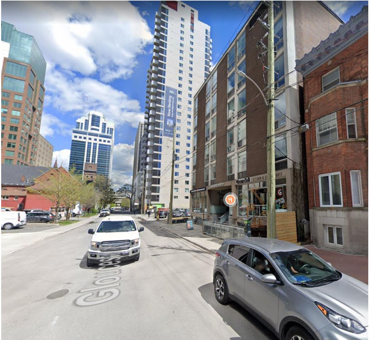
East facing view, standing on Gloucester Street