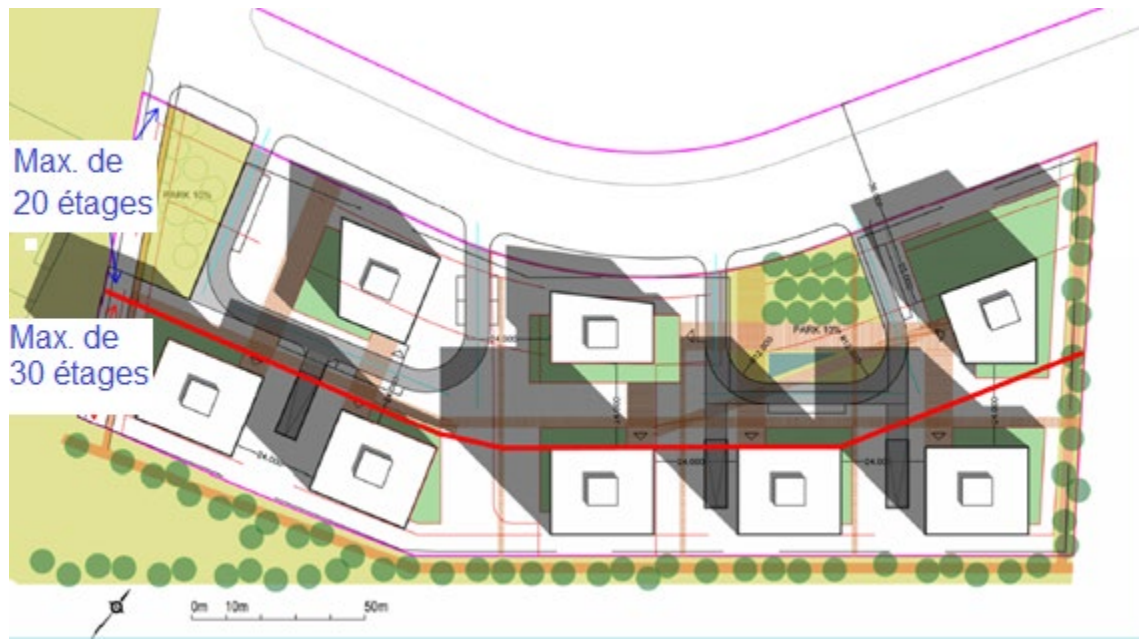
Figure 2 : Limites de hauteur suggérées pour le zonage, Source : Justification de l'aménagement – Modification du Plan officiel et modification du Règlement de zonage concernant le bien-fonds du 1900 et 2000 promenade City Park, page 30 (figure 14).