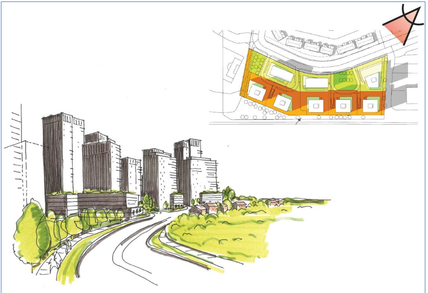
Figure 2: Street View – From City Park Drive Going West / Vue de la rue – Arrivant de la promenade City Park et se dirigeant vers l'ouest