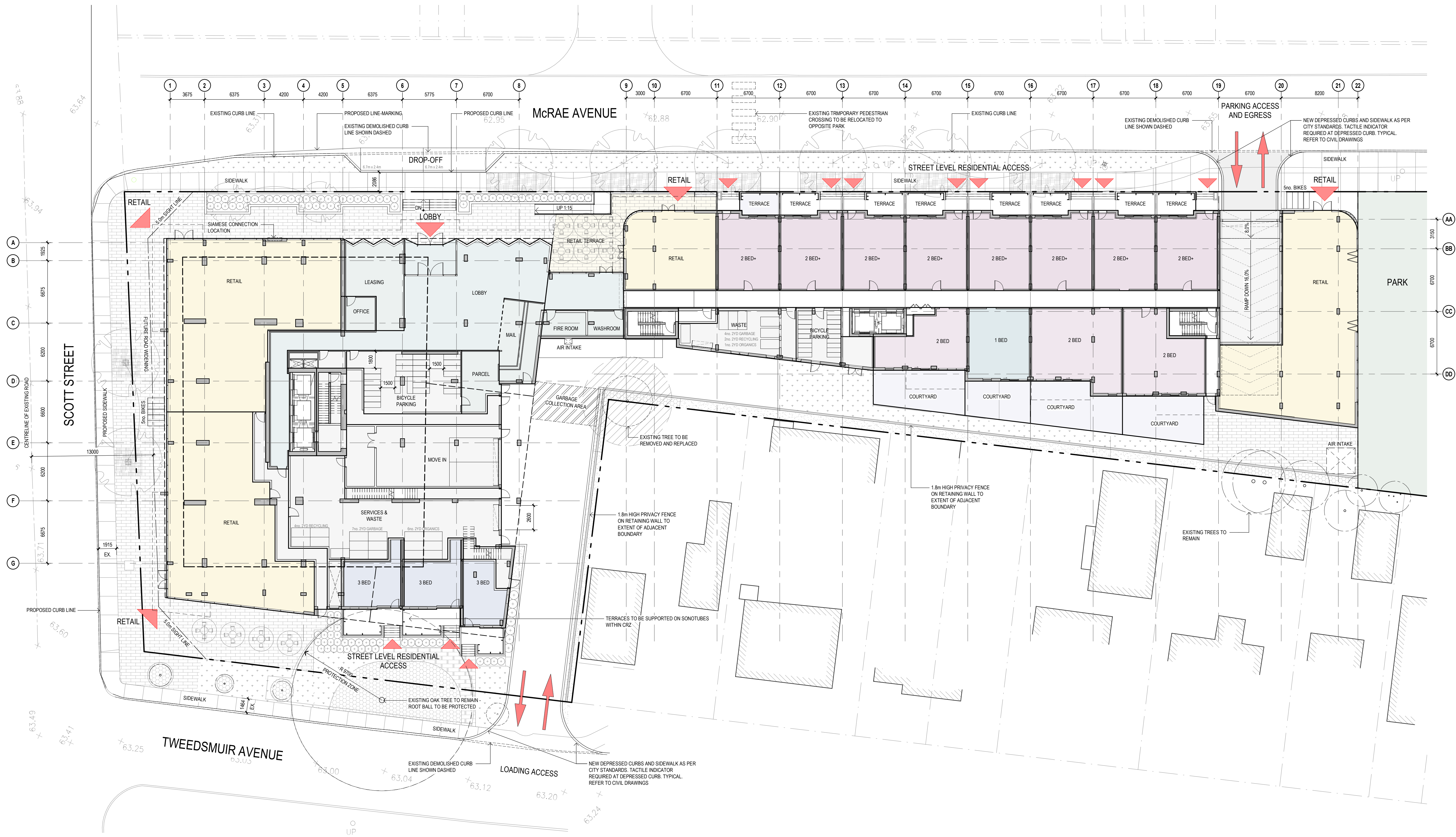
FLOOR PLAN - GROUND LEVEL 1:200

NOTES GÉNÉRALES / General Notes Ces documents d'architecture sont la propriété exclusive de NEUF architect(e)s et ne peuvent être utilisés, reproduits ou copiés sans autorisation écrite préalable. / These architectural documents are the exclusive property of NEUF architect(e)s and cannot be used, copied or reproduced without written pre-authorization. Les dimensions apparaissant aux documents doivent être vérifiées par l'entrepreneur avant le début des travaux. / All dimensions appearing on these documents must be verified by the contractor prior to construction. Veuillez aviser l'architecte de toute dimension erronée et/ou divergences entre ces documents et ceux des autres professionnels. / The architect must be notified of all errors, omissions and discrepancies between these documents and those of the other professionals. Les dimensions sur ces documents doivent être lues et non mesurées. / The dimensions on these documents must be read and not measured.