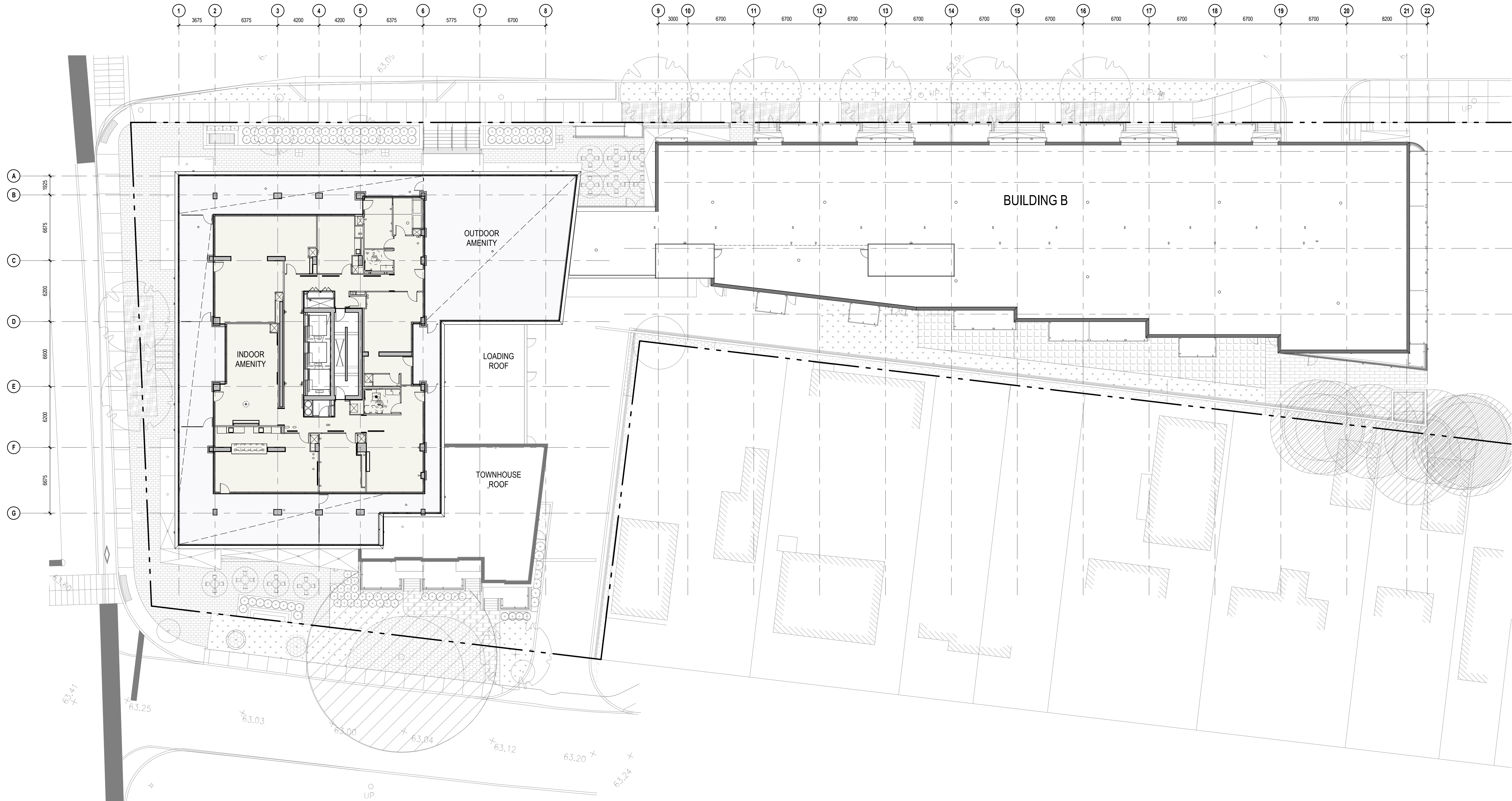
FLOOR PLAN - LEVEL 7 AMENITY 1:200