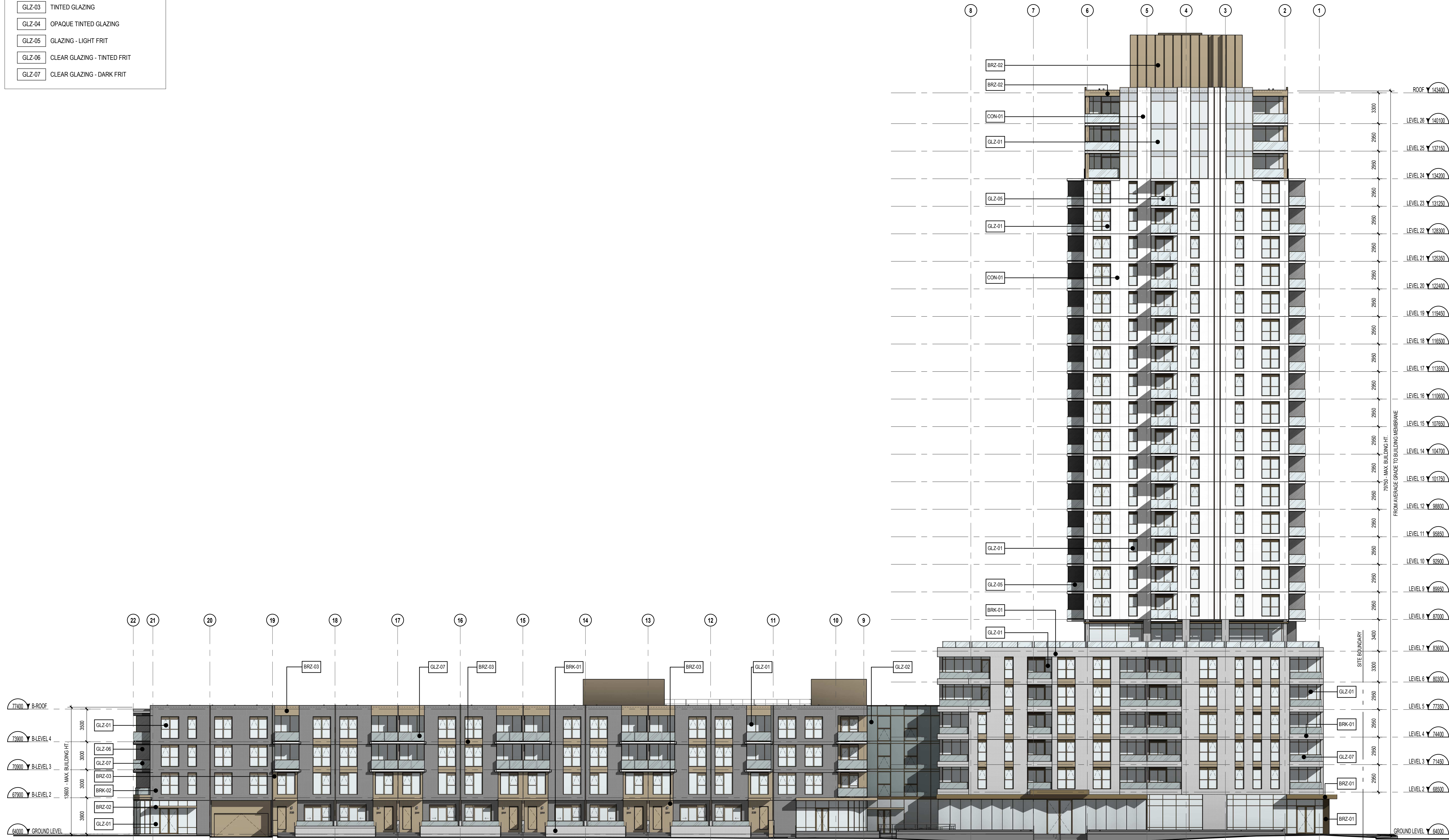
ELEVATION - EAST 1:200