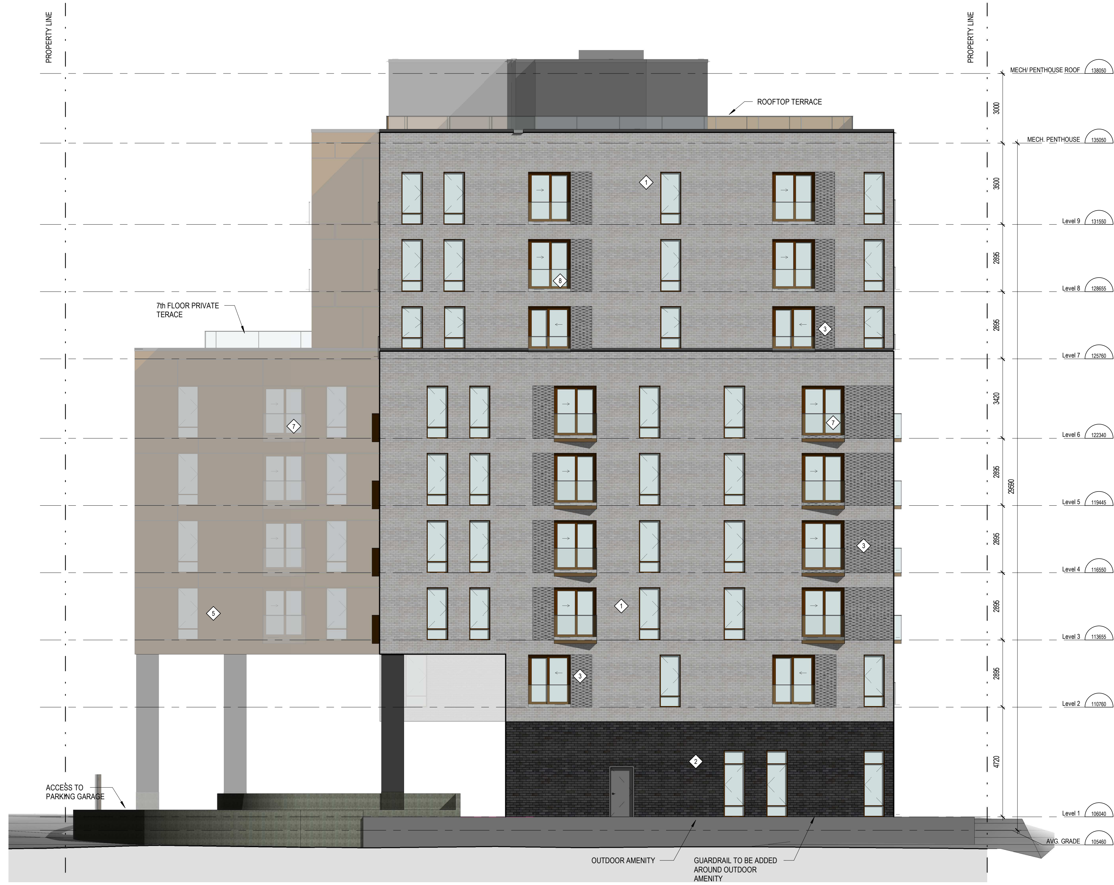
1 NORTH ELEVATION AZ02 ECHELLE / SCALE: 1:100