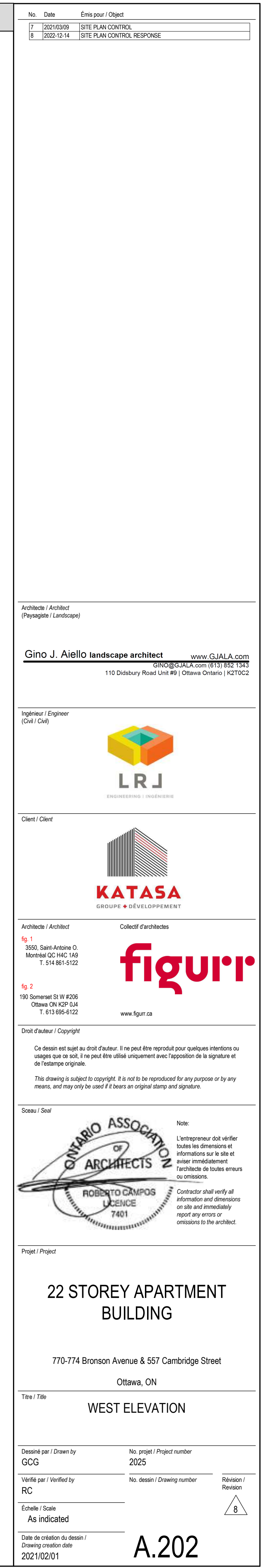
1 A.202 WEST ELEVATION 1 : 200