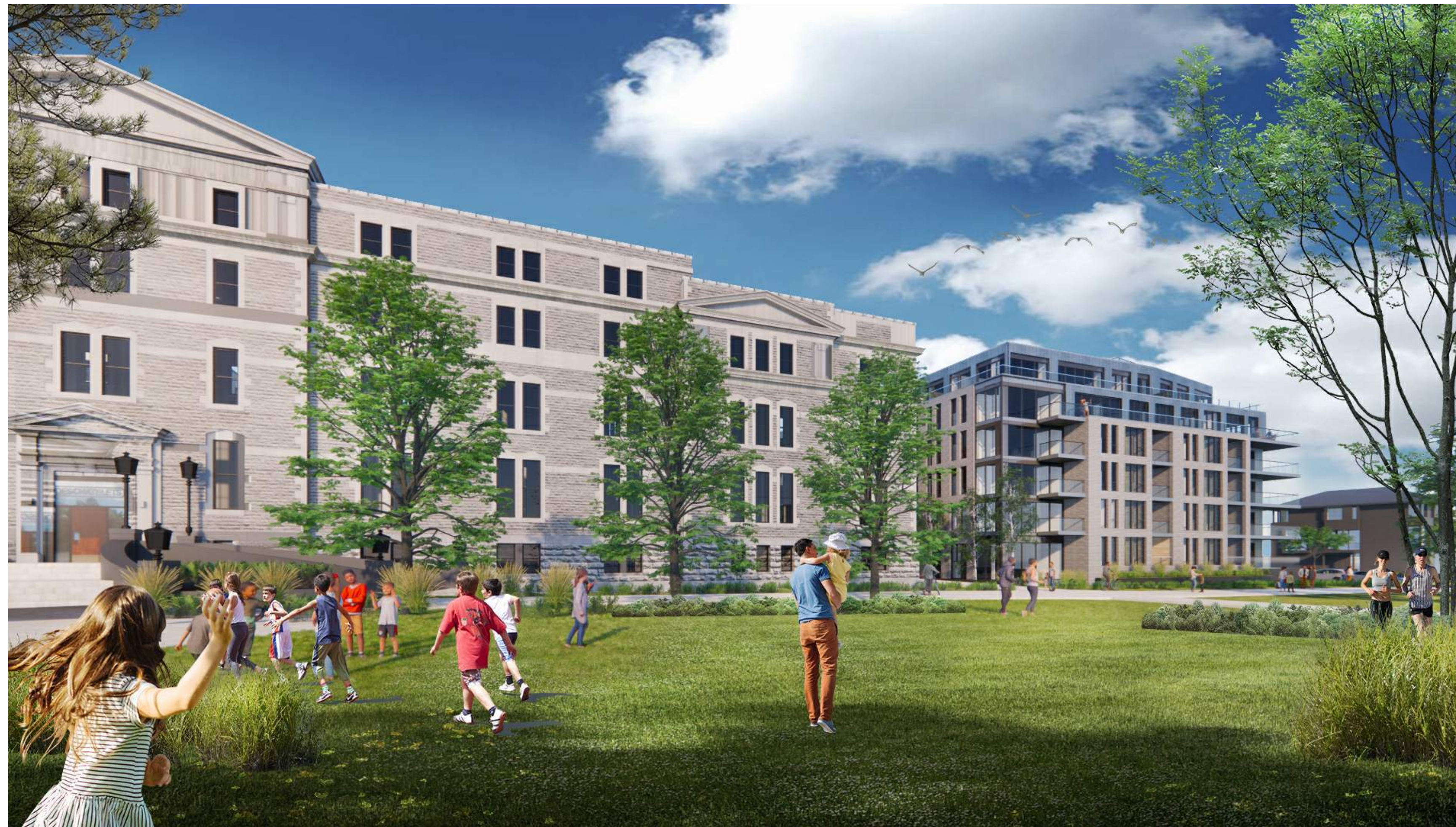
SOUTH BUILDING - NORTHWEST CORNER