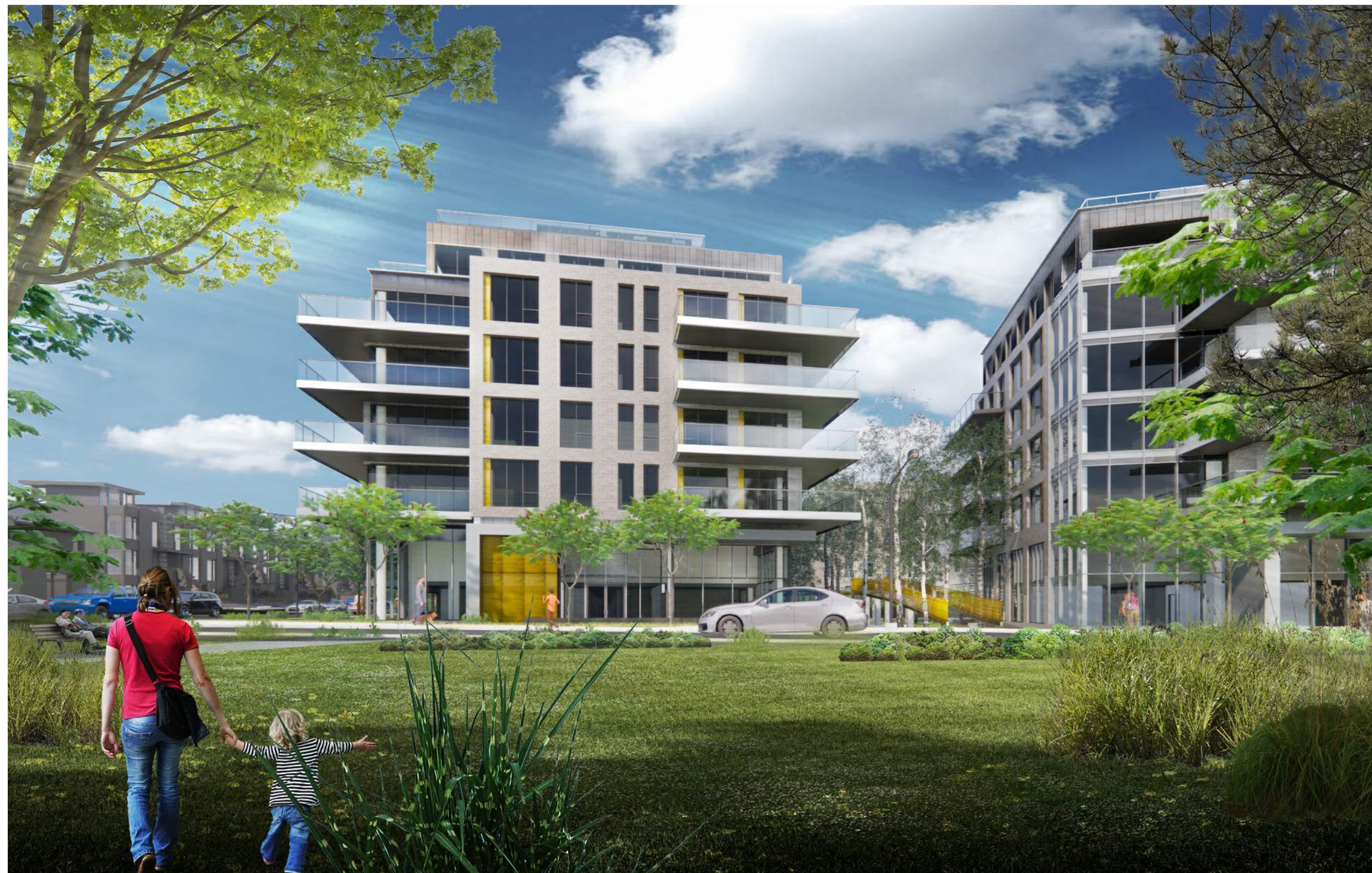
SOUTH BUILDING - SOUTHEAST CORNER