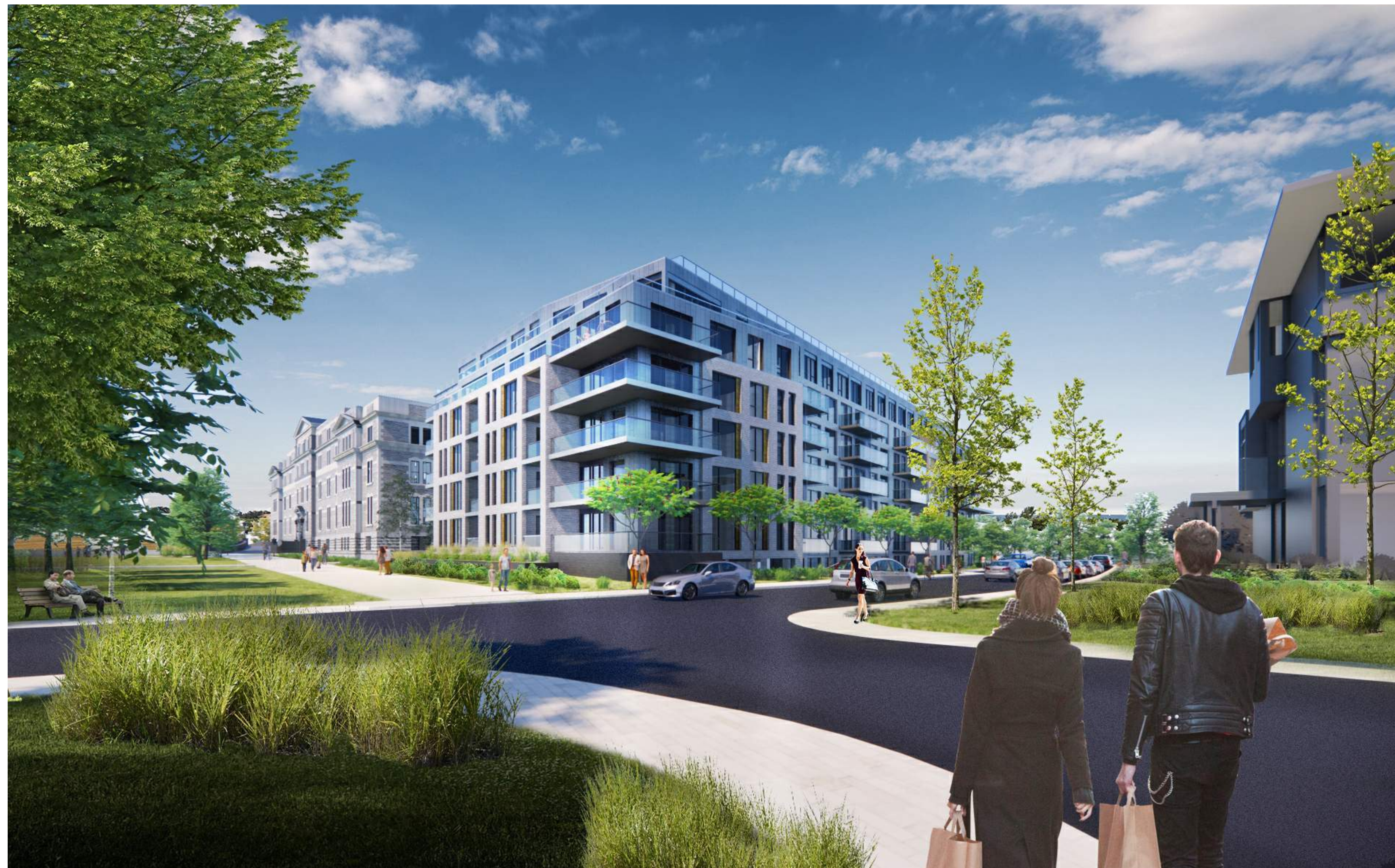
SOUTH BUILDING - SOUTHWEST CORNER