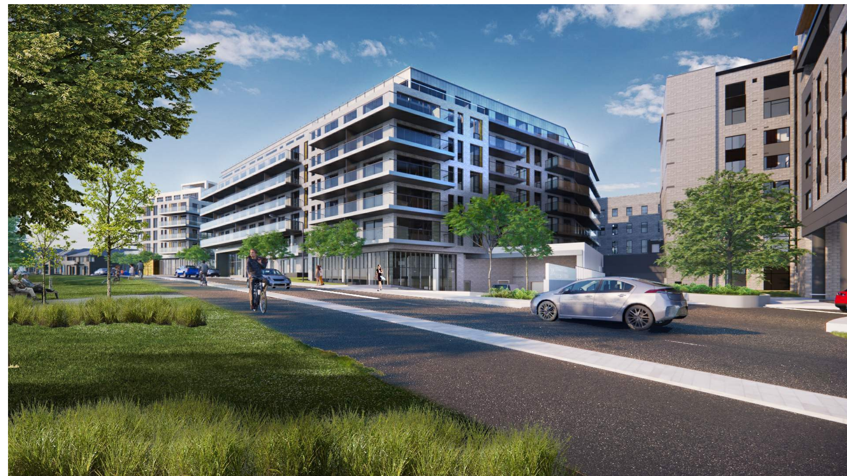
NORTH BUILDING - NORTHEAST CORNER