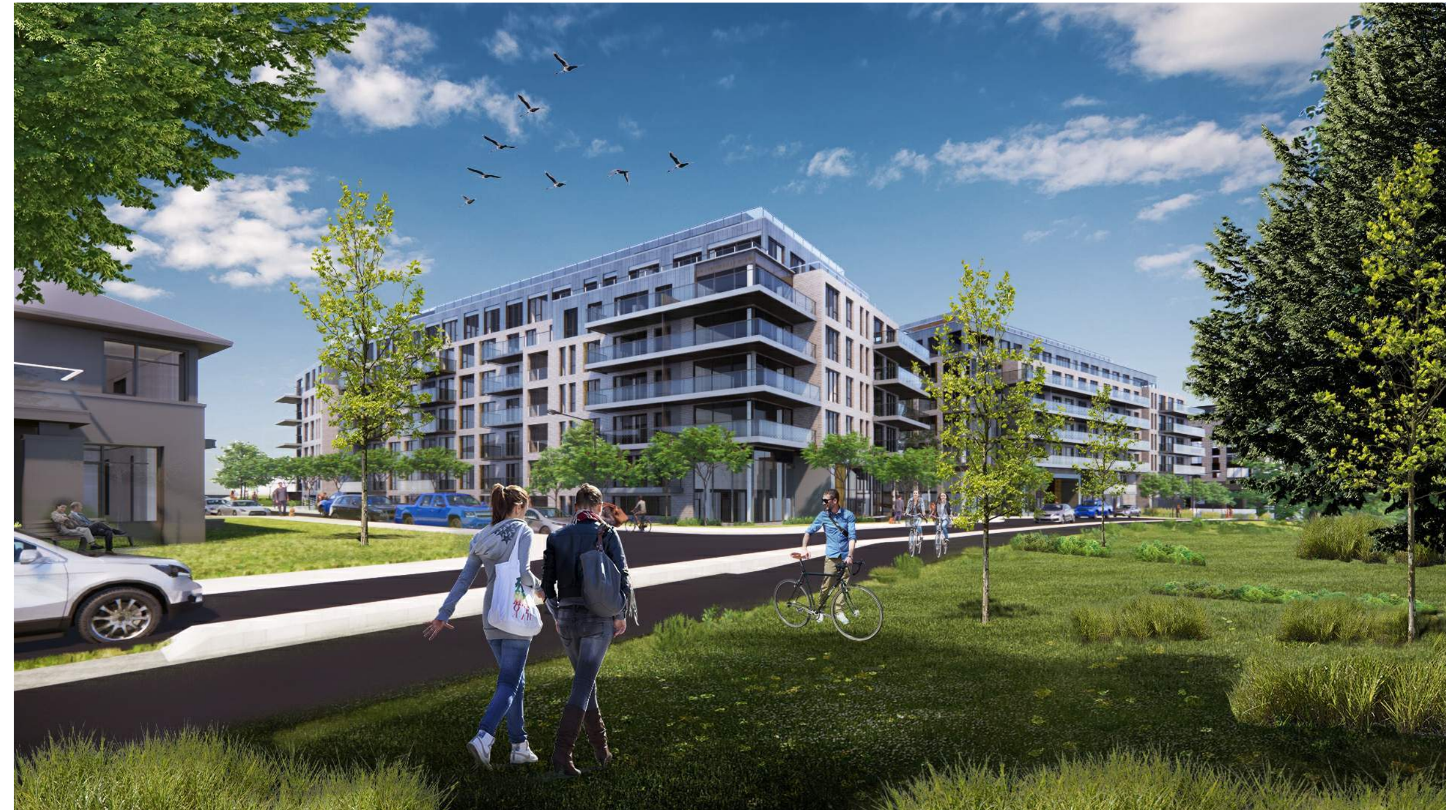
SOUTH BUILDING - SOUTHEAST CORNER