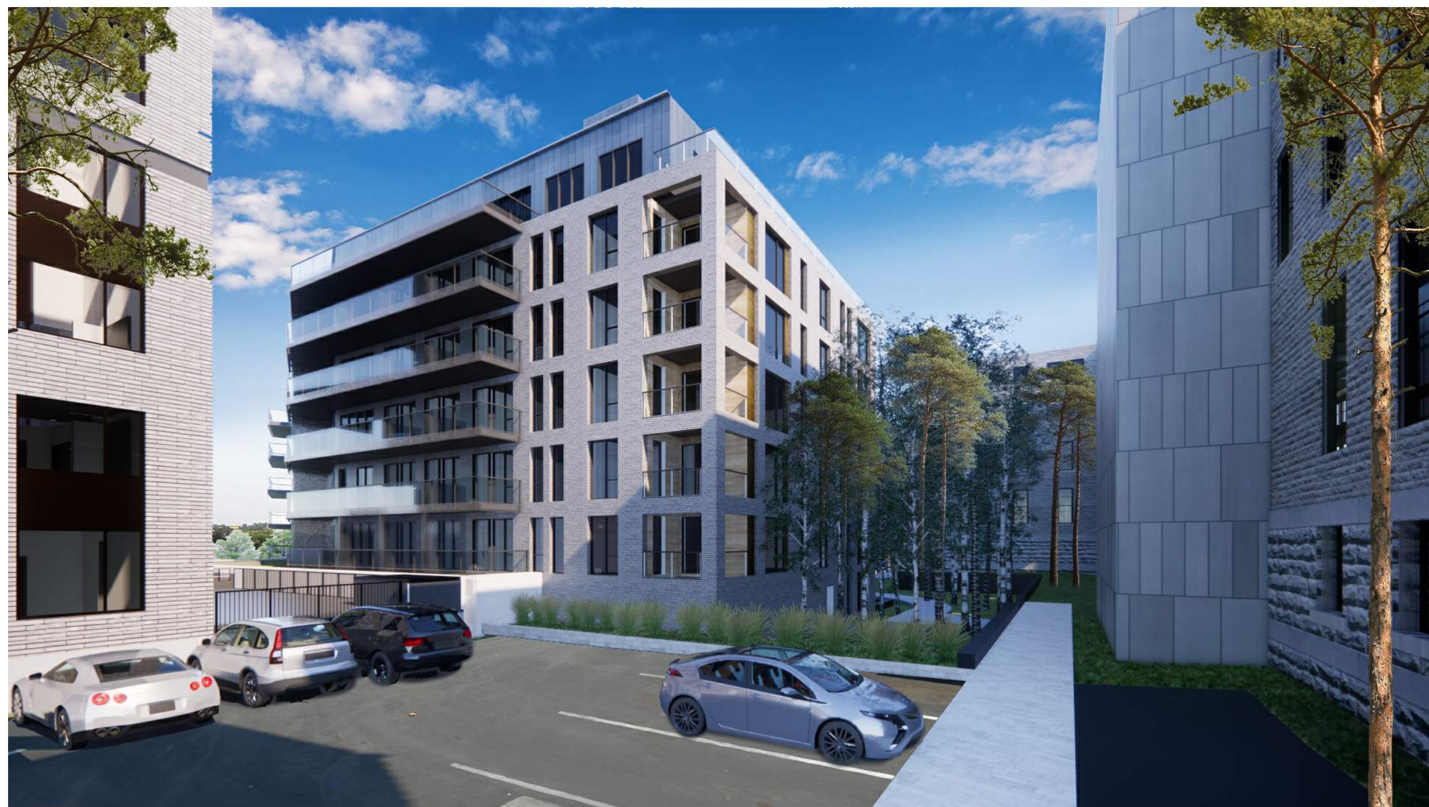
NORTH BUILDING - NORTHWEST CORNER