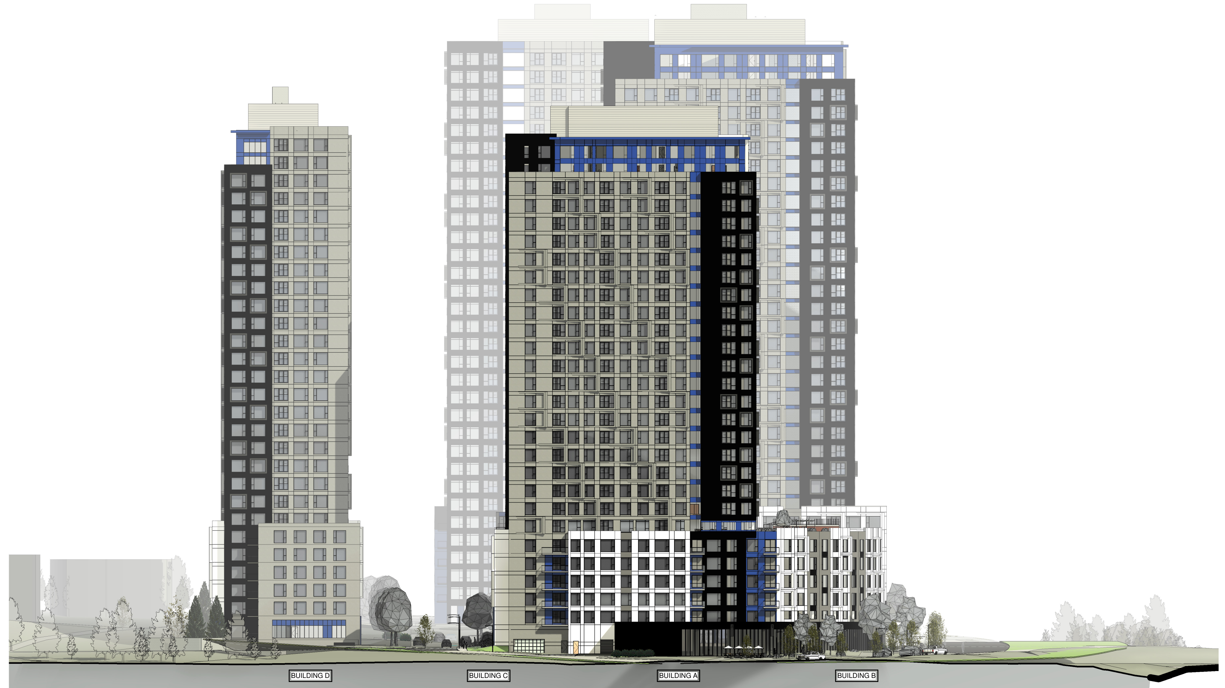
2 WEST ELEVATION A20 1:400