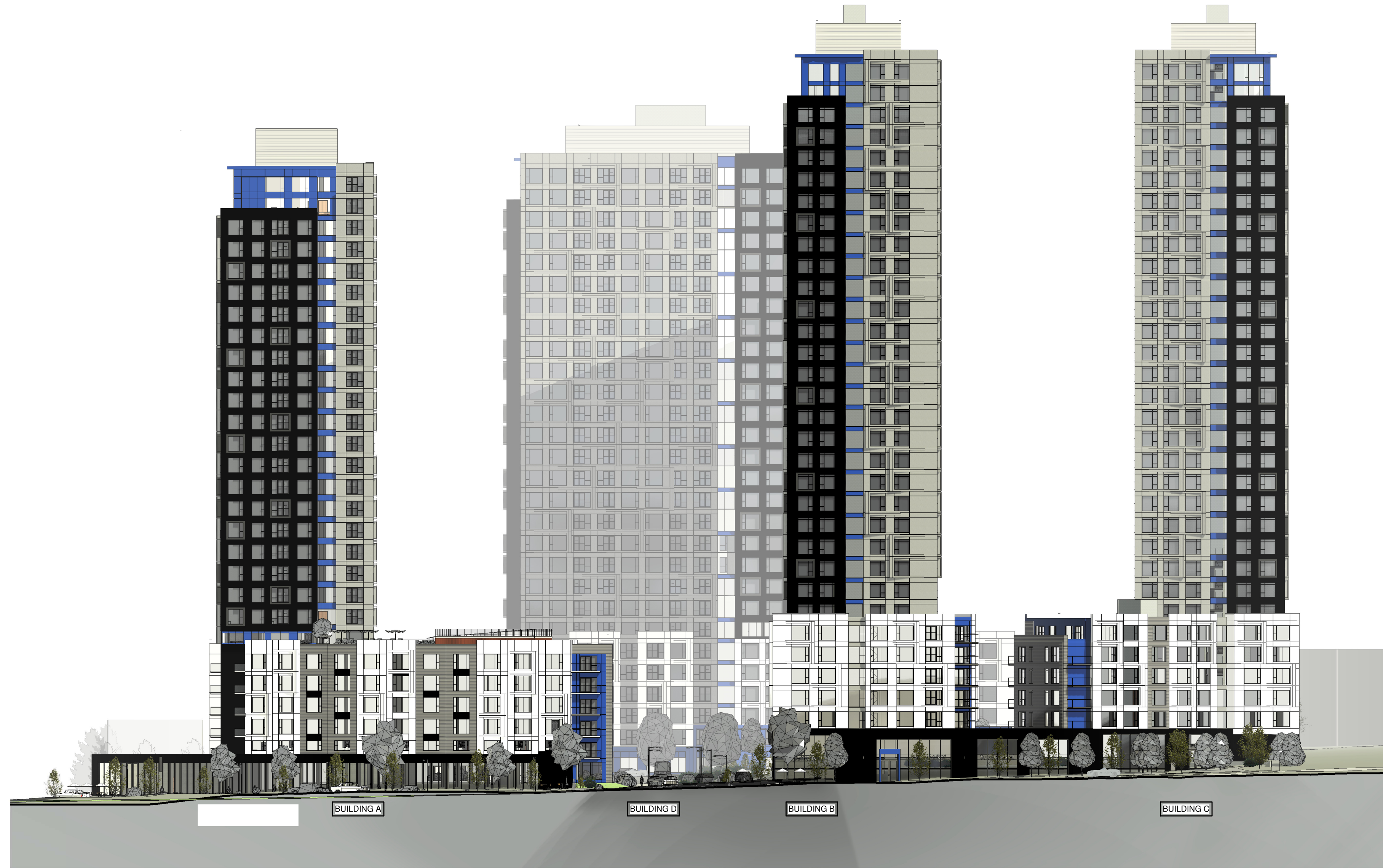
1 SOUTH ELEVATION A20 1:400