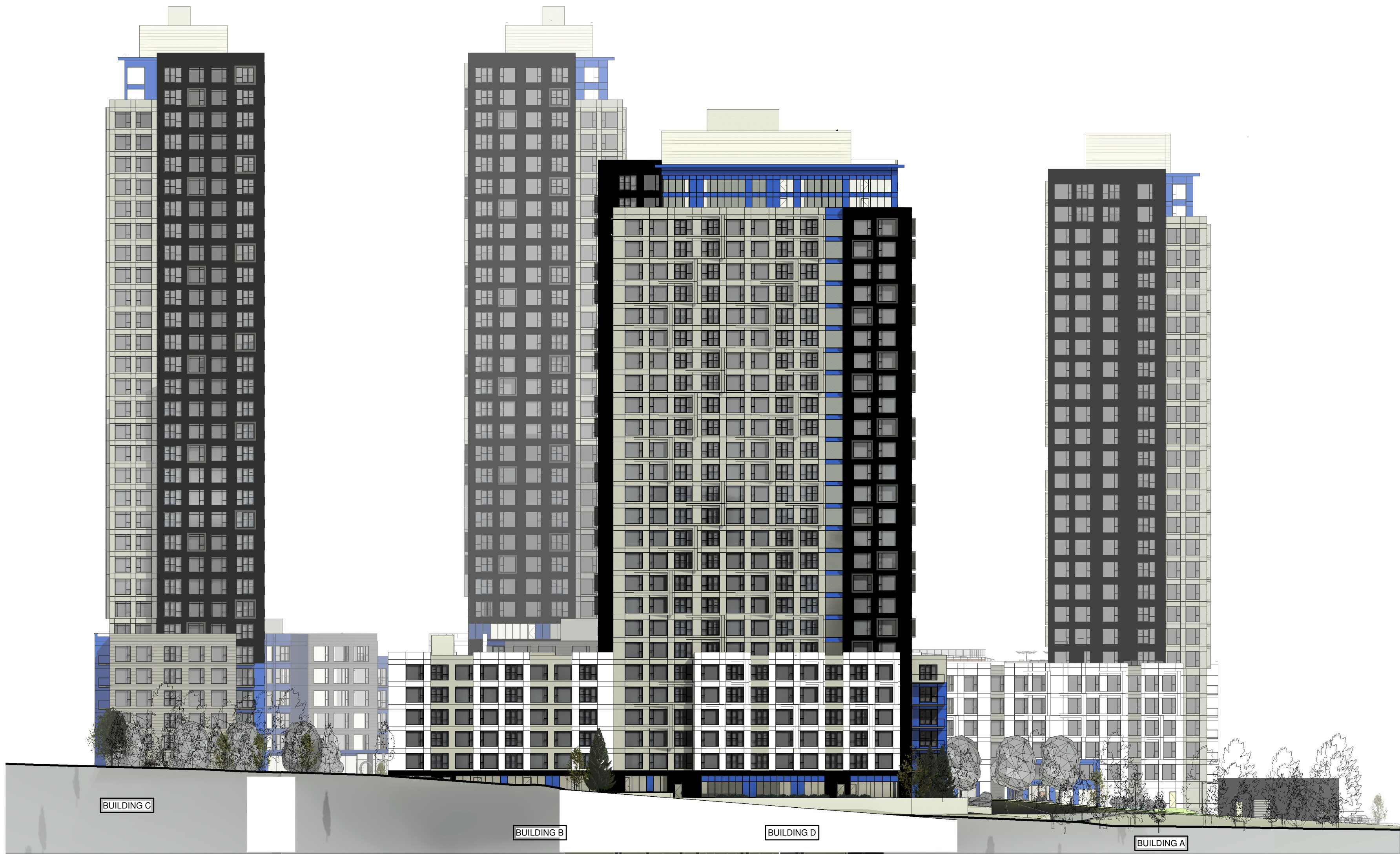
3 NORTH ELEVATION A20 1:400