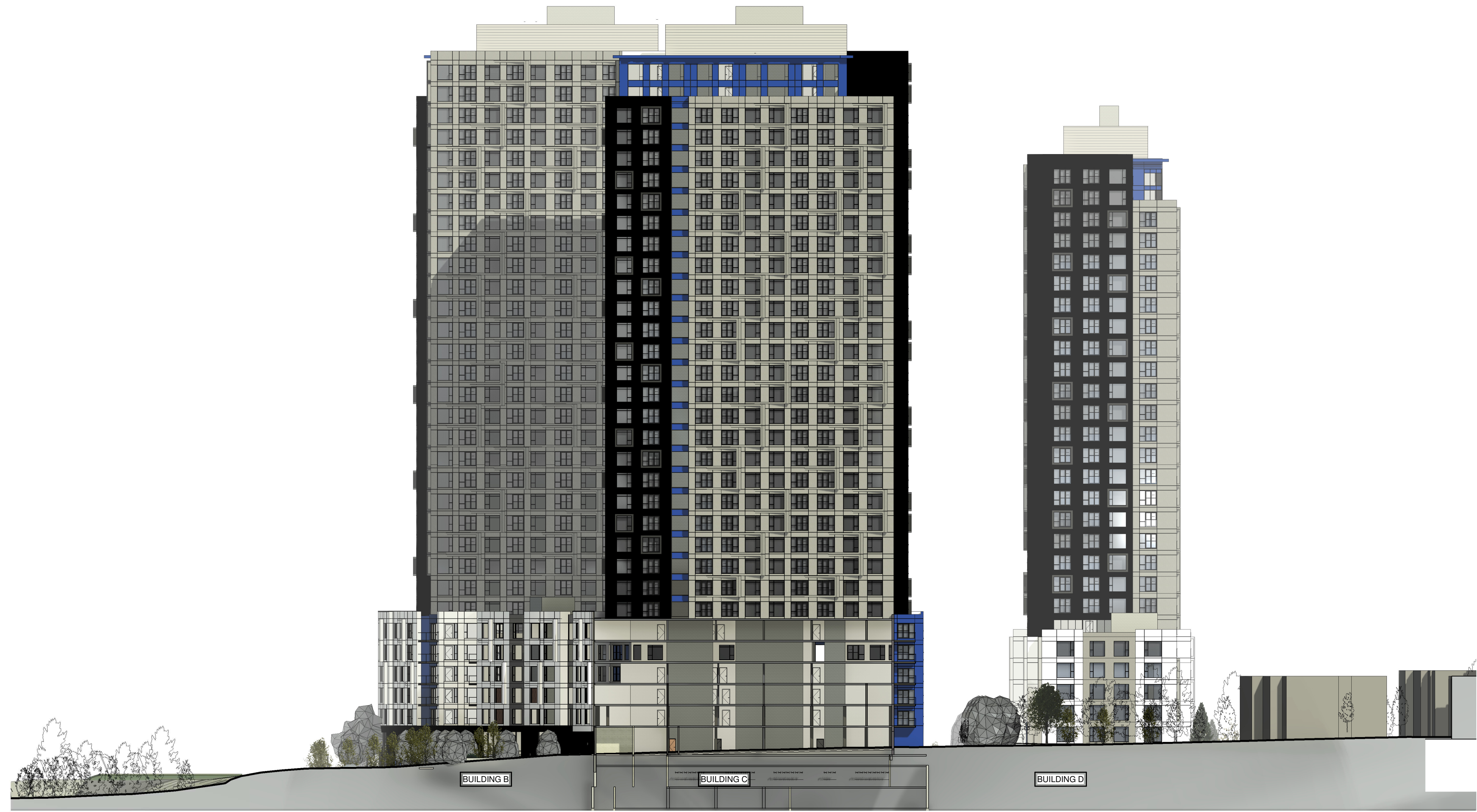
4 EAST ELEVATION A20 1:400