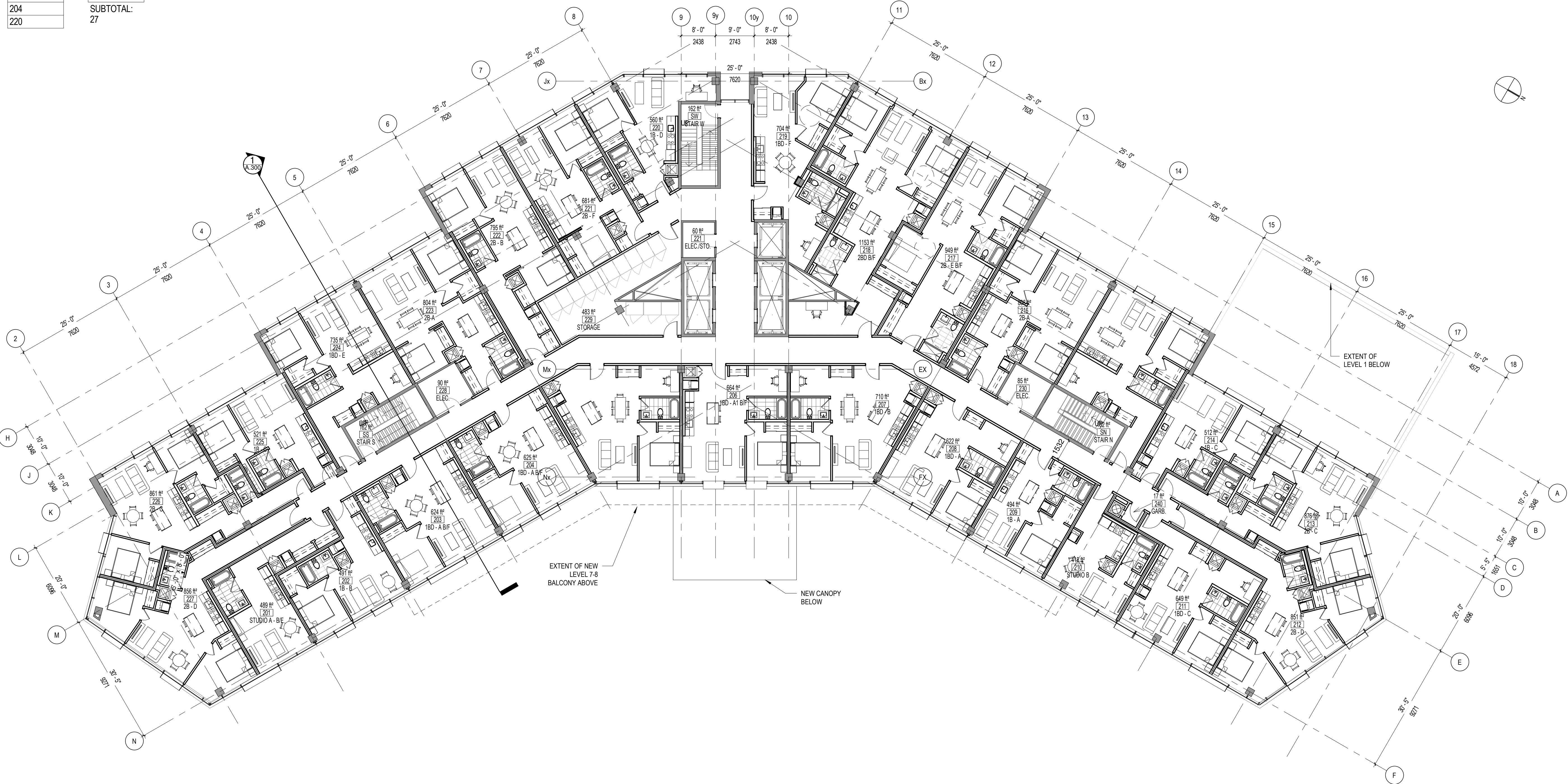
1 FLOOR PLAN - LEVEL 2 - 6 A-122 ECHELLE / SCALE: 1:150