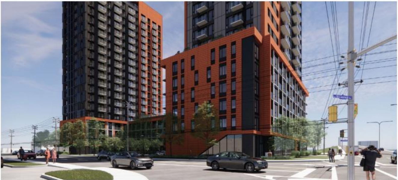
Figure 12: Perspective Looking Southeast from Belfast Road at St. Laurent Boulevard