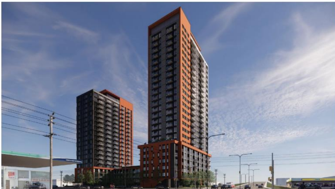
Figure 9: Proposed massing of development from St. Laurent Boulevard, looking south