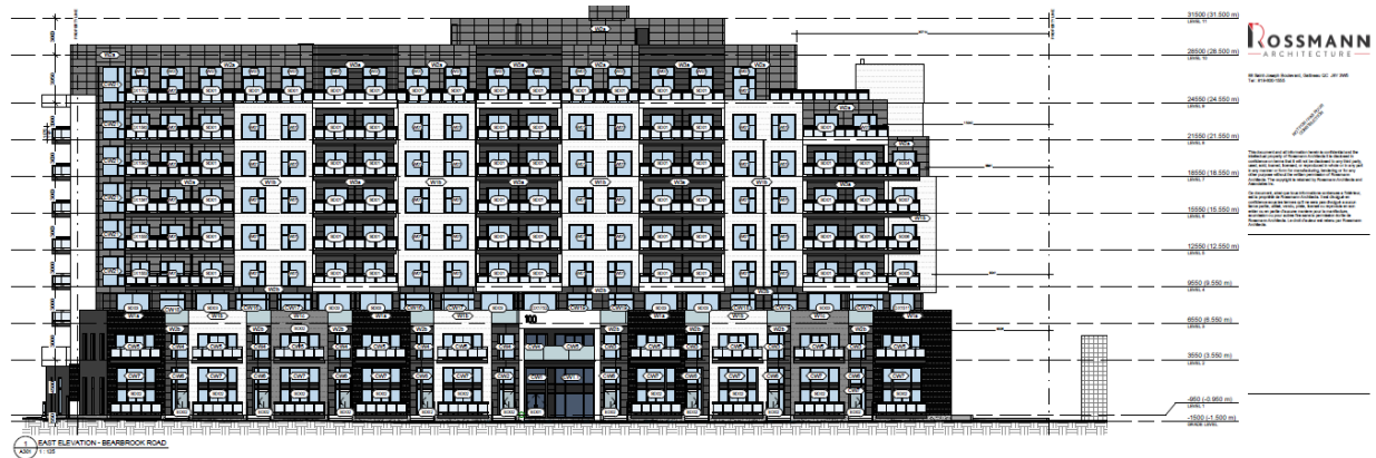
Figure 1: View from Bearbrook Road. Source Rossmann Architecture / Figure 1 : Vue depuis le chemin Bearbrook. Source Rossmann Architecture.