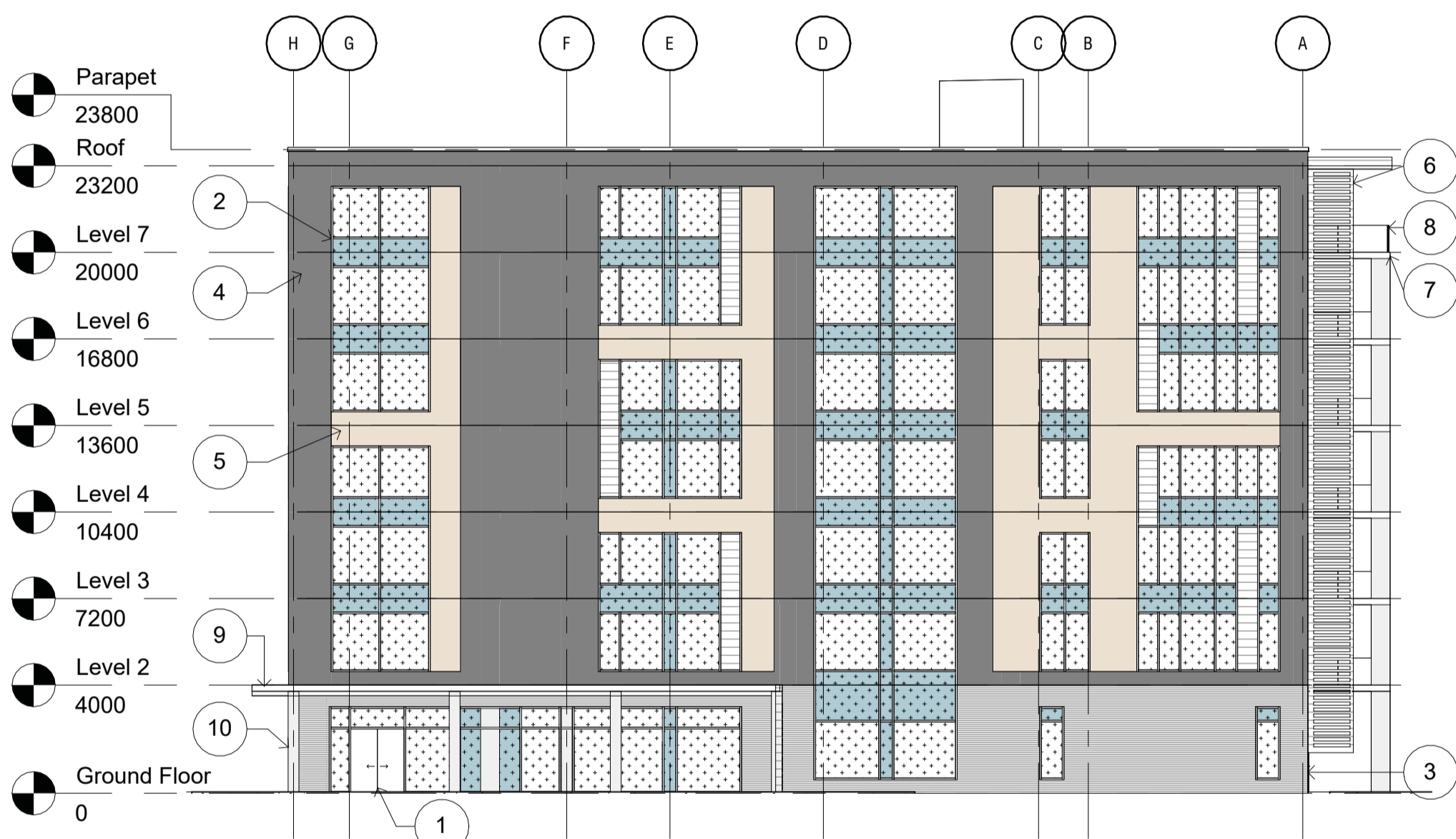
2 East Elevation - SPC A200SP 1:200