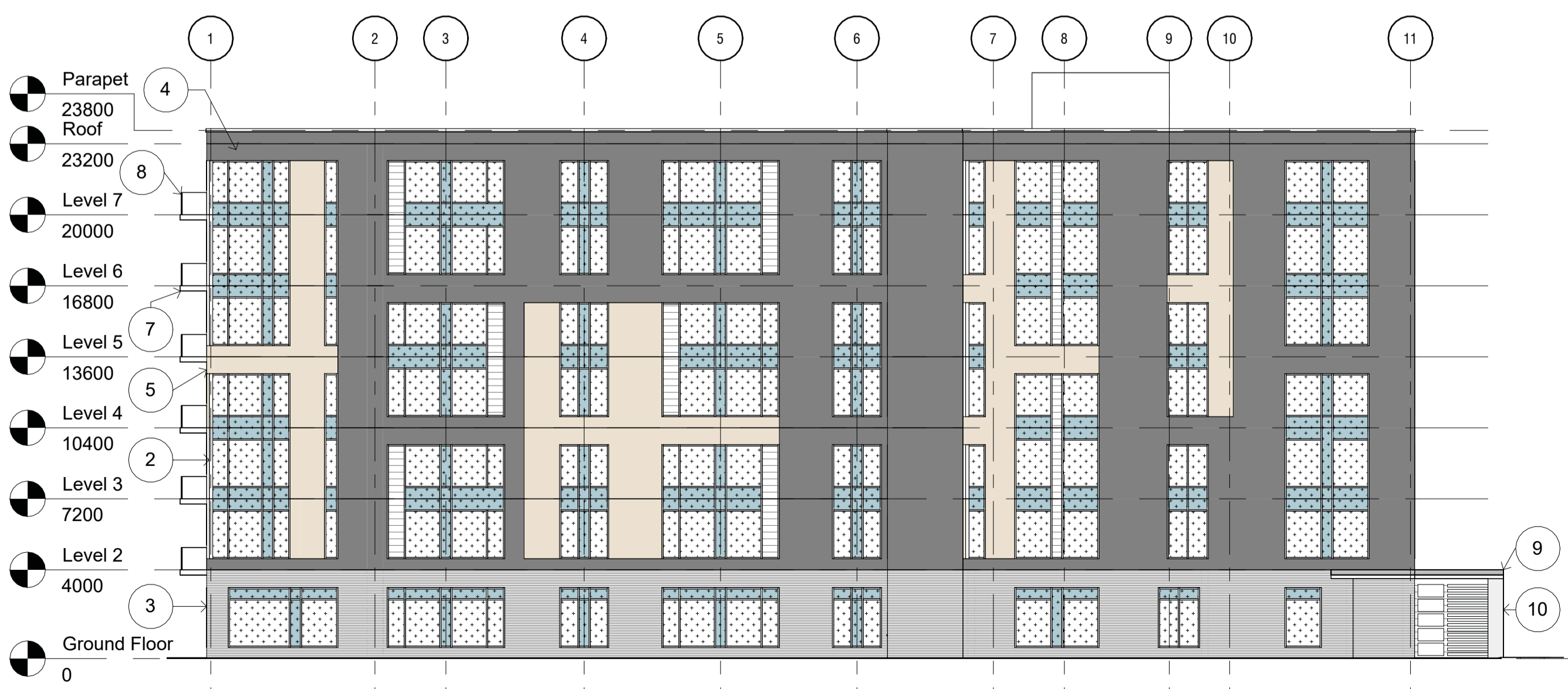
4 South Elevation - SPC A200SP 1:200