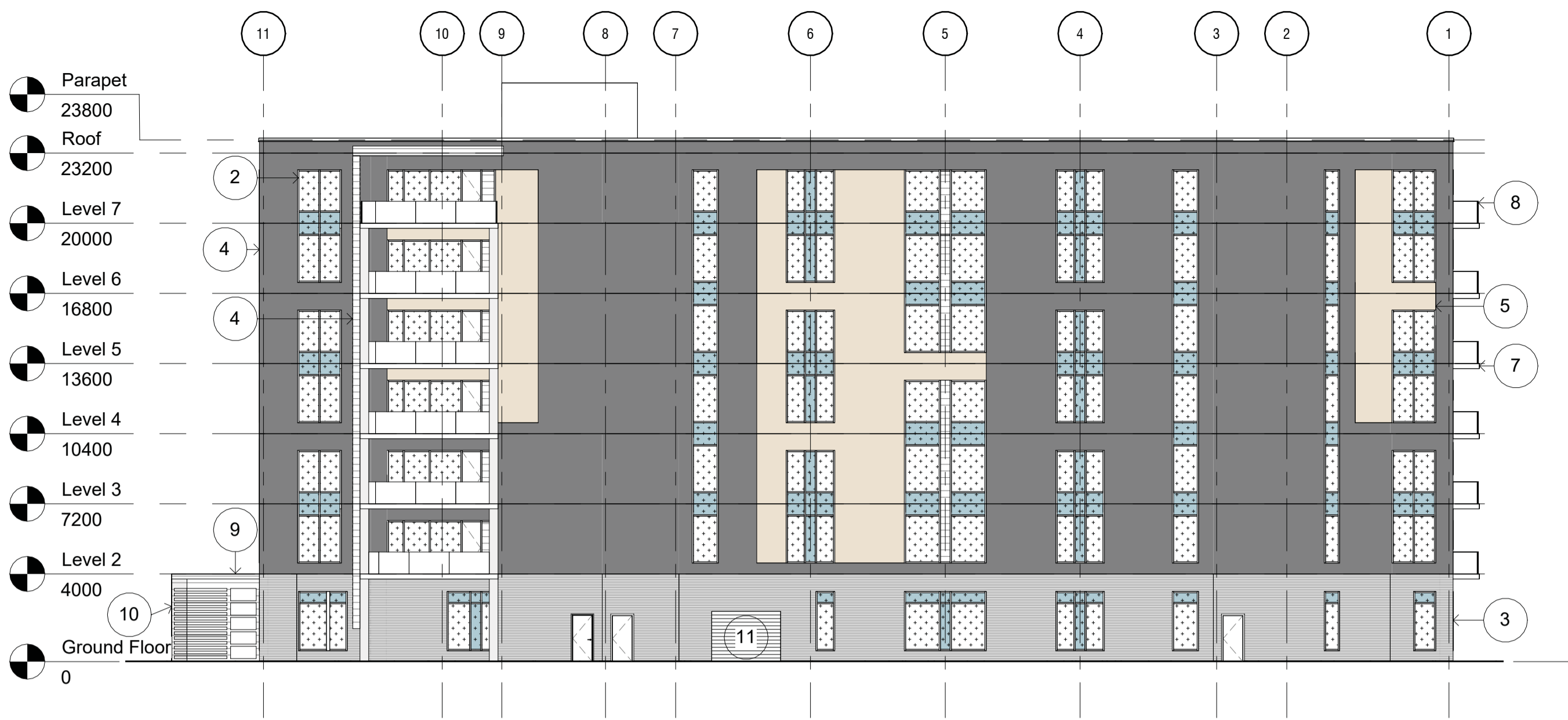
1 North Elevation - SPC A200SP 1:200