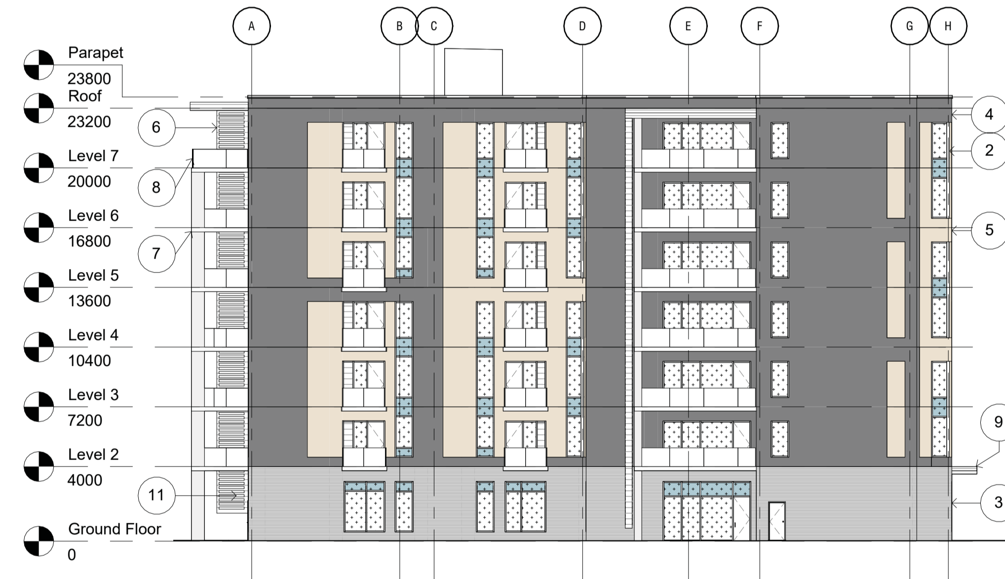
3 West Elevation - SPC A200SP 1:200