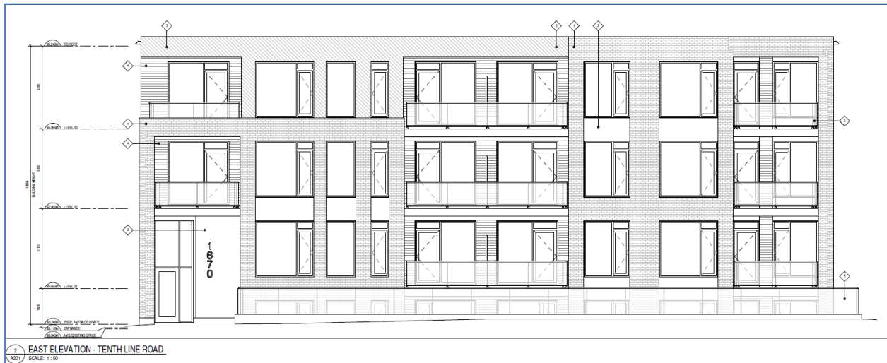
Figure 1: East Elevation – Tenth Line Road, Source: Drawing A201, prepared by Project 1 Studio, dated August 12, 2025, revision 3 dated October 16, 2025